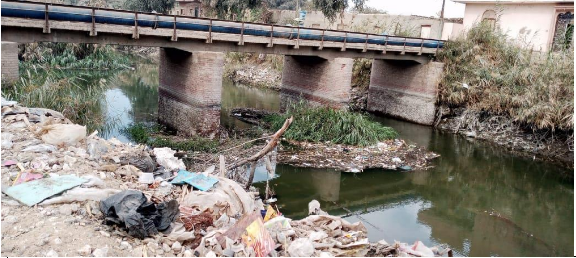
شكل (2-3): صور توضح تهالك ومحدودي اتساع الكوبري القديم

ويعتبر الموقع الحالي هو الموقع الذي تستخدمه الأهالي للانتقال من خلال الكوبري المتهاك والضيق والذي لا يكفي لمرور السيارات وخاصة في نقل منتجاتهم واحتياجاتهم من وإلى القرية.