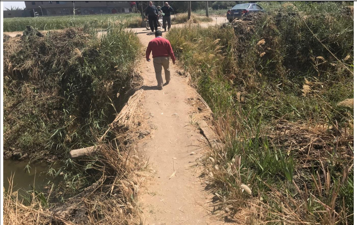
شكل (3-2) الوضع الحالي للمرور على المصرف لاهالى التجمعات السكنية المجاورة للكوبرى