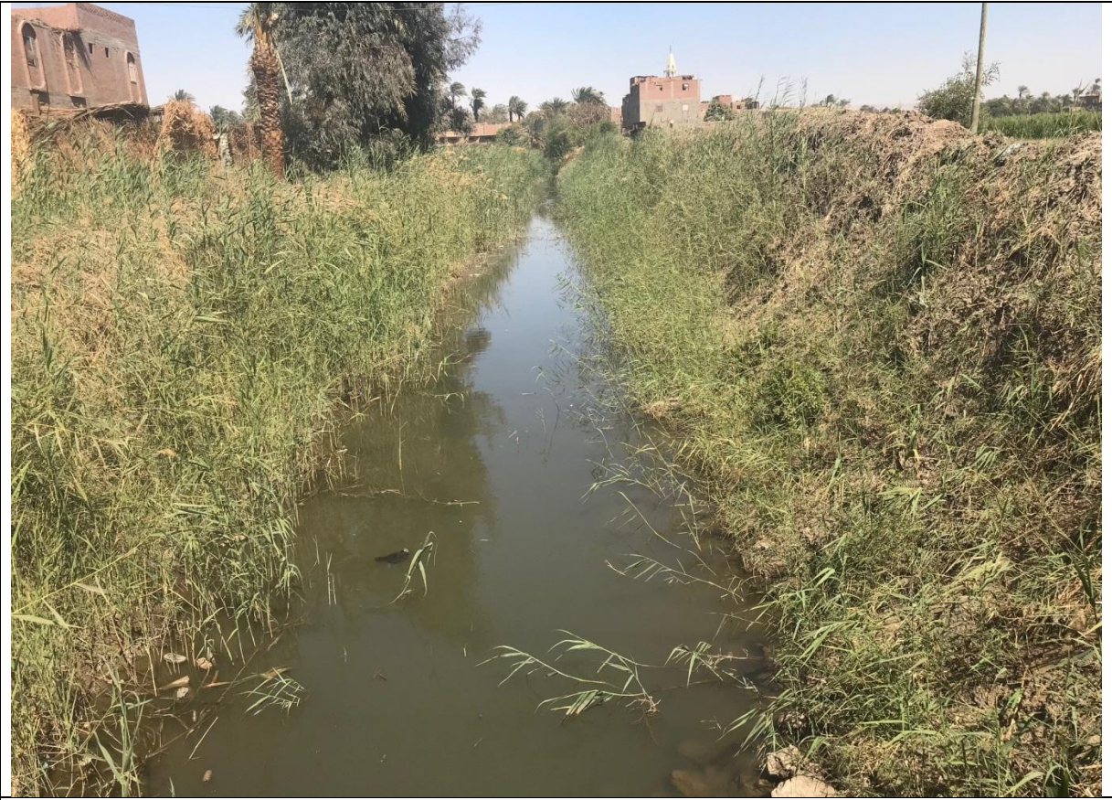
شكل (2-2) صورة توضح مصرف اولاد بهيج والمزعم انشاء المشروع عليه