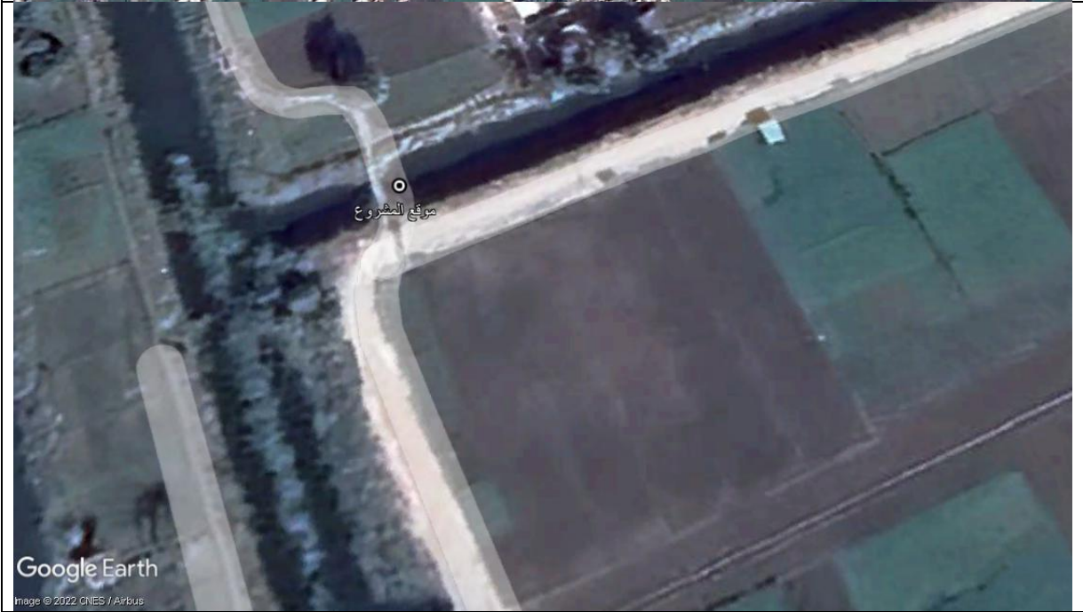
شكل (1-2): صورة جوية (Google earth) موضح عليها موقع المشروع على مصرف اولاد بهيج لخدمة اهالى المناطق المجاورة للكوبرى