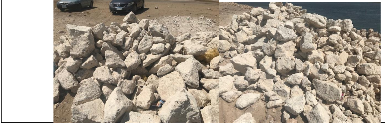
شكل رقم (3-8): تشوينات الحجر الجيري الكلسي بموقع المشروع

درجة التحبب بصورة عامة دقيقة الحجم إلى متوسط ويتراوح حجم الحبيبات من 0.2 مم إلى 2.0 ملليمتر، ما عدا فى منطقة وادي قصب ومنطقة الكوامل فإن الرمل بهاتين المنطقتين من النوع الخشن كبير إلى متوسط التحبب (أى أكبر من 2 ملليمتر)، توجد العديد من المحاجر فى المناطق الملاصقة للأراضي الزراعية والتي يتم إستغلالها بصورة عشوائية وبدائية، لا تحتاج إلى تكلفة سهلة الكشف والنقل بمعدات بسيطة مثل اللودر والهازات.