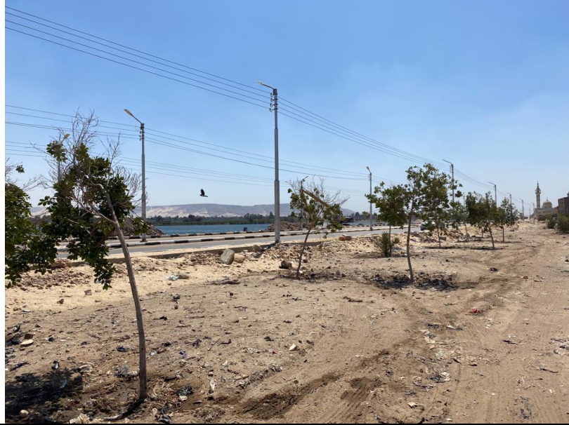
شكل رقم (3-7): بداية الحديقة التي يتم تنفيذها بمعرفة مجلس مدينة المنشاه في المنطقة المجاورة للمشروع