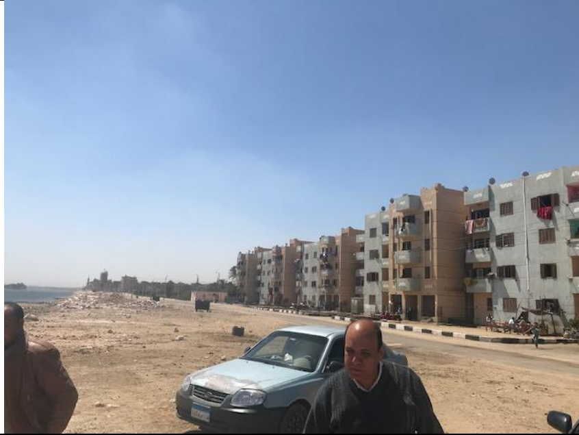
شكل رقم (4-3): بداية أعمال التدبيش من الناحية الشمالية عن حدود قرية السماكين