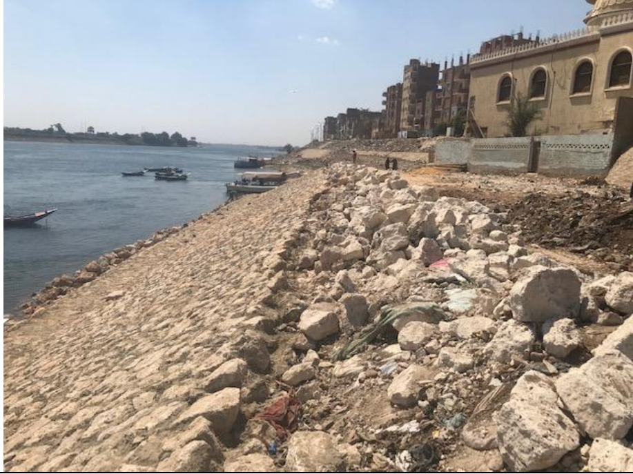
شكل رقم (3-3): أعمال التدبيش الجارية بالمشروع والتكسية بالحجر