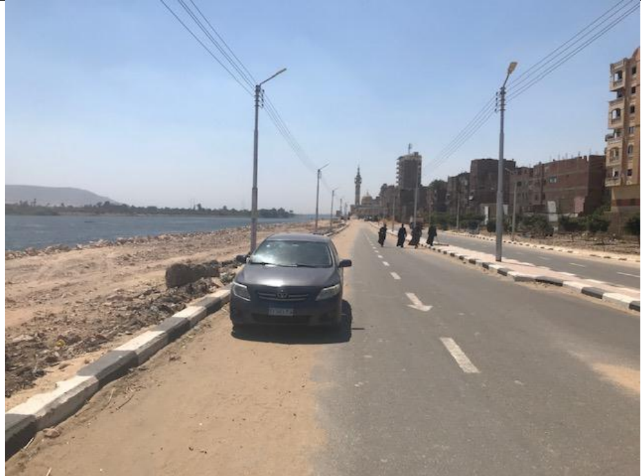
شكل رقم (3-6): طريق الكورنيش الجديد بجوار المشروع