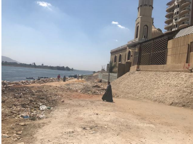
شكل رقم (3-5): تبين نهاية المرحلة الأولى عند مسجد الصحابة