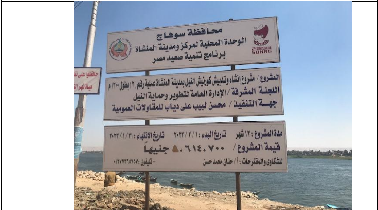
شك رقم (2-2): لافتة المشروع موضحة عليها بيانات المشروع وإسم الشركة المنفذه