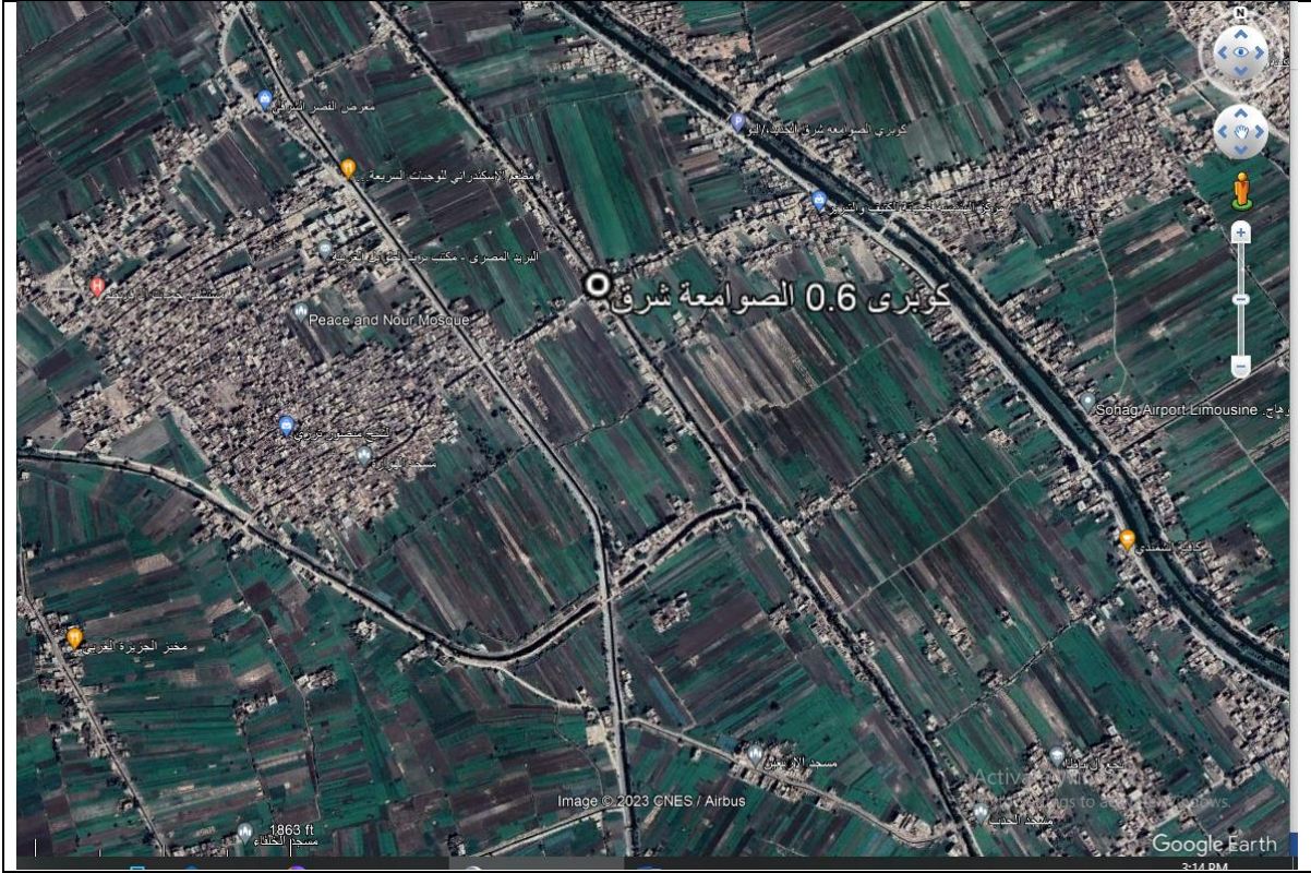
شكل (1-3) : موقع الكوبري والأنشطة المحيطة به