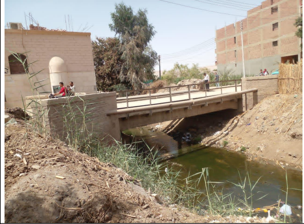
شكل (3-2): صور توضح تهالك ومحدودي اتساع الكوبري القديم

ويعتبر الموقع الحالي هو الموقع الذي تستخدمه الأهالي للإنتقال من خلال الكوبري المتهاك والضيق والذي لا يكفي لمرور السيارات وخاصة في نقل منتجاتهم وإحتياجاتهم من وإلى القرية.