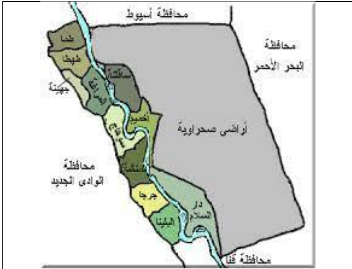
شكل (1-4): خريطة ادارية لمحافظة سوهاج

ويحد المحافظة من الشمال محافظة أسيوط ومن الجنوب محافظة قنا (الخريطة رقم 1-4)، وتحدها من الشرق محافظة البحر الأحمر والصحراء الشرقية، ومن الغرب محافظة الوادي الجديد والصحراء الغربية.