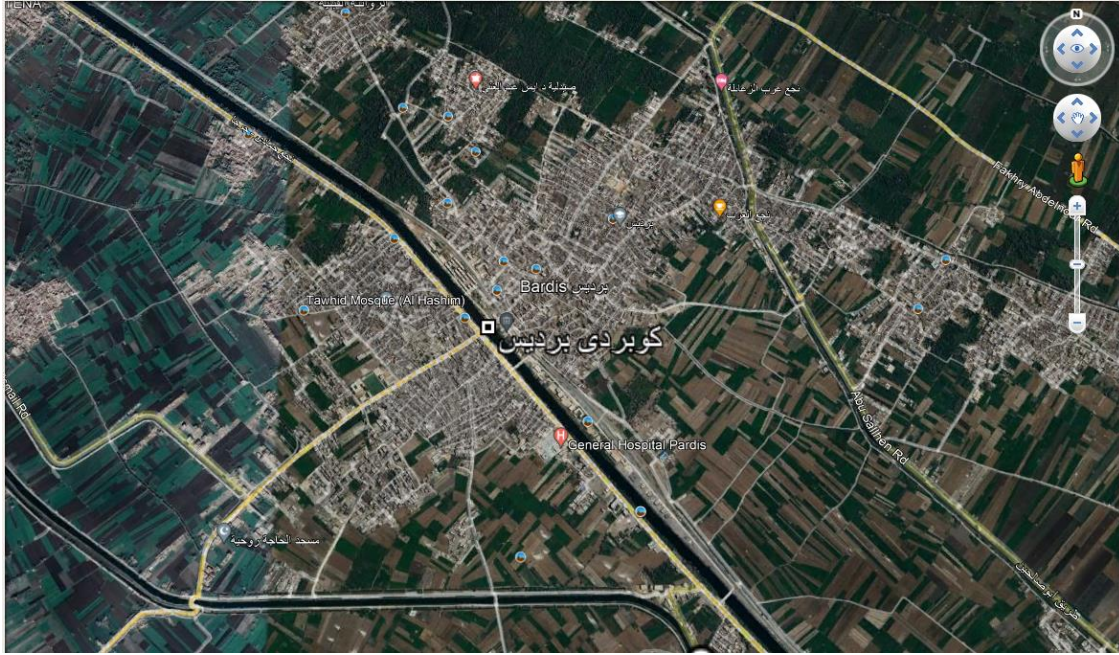
شكل (1-2) : موقع كوبري برديس والأنشطة المحيطة به

ويوضح شكل رقم (1-2) موقع المشروع من خلال خريطة من Google Earth عند الإحداثي المذكور، ويمثل الشكل رقم (2-2) صور للكوبري القديم والمراد إحلاله وتجديده.