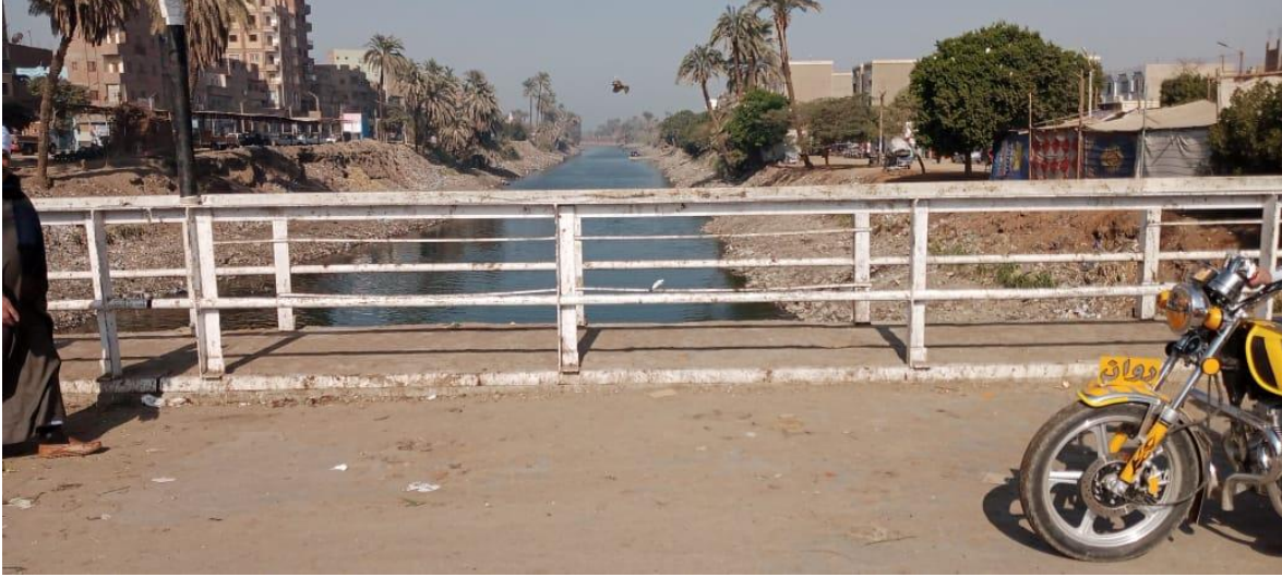
شكل (2-2): صور توضح كوبري برديس على ترعة نجع حمادي الغربية

ويعتبر الموقع الحالي هو الموقع الذي تستخدمه الأهالي للإنتقال من خلال الكوبري المتهاك والضيق، فهو غير آمن لمرور السيارات وخاصة في نقل منتجاتهم واحتياجاتهم من وإلى القرية.