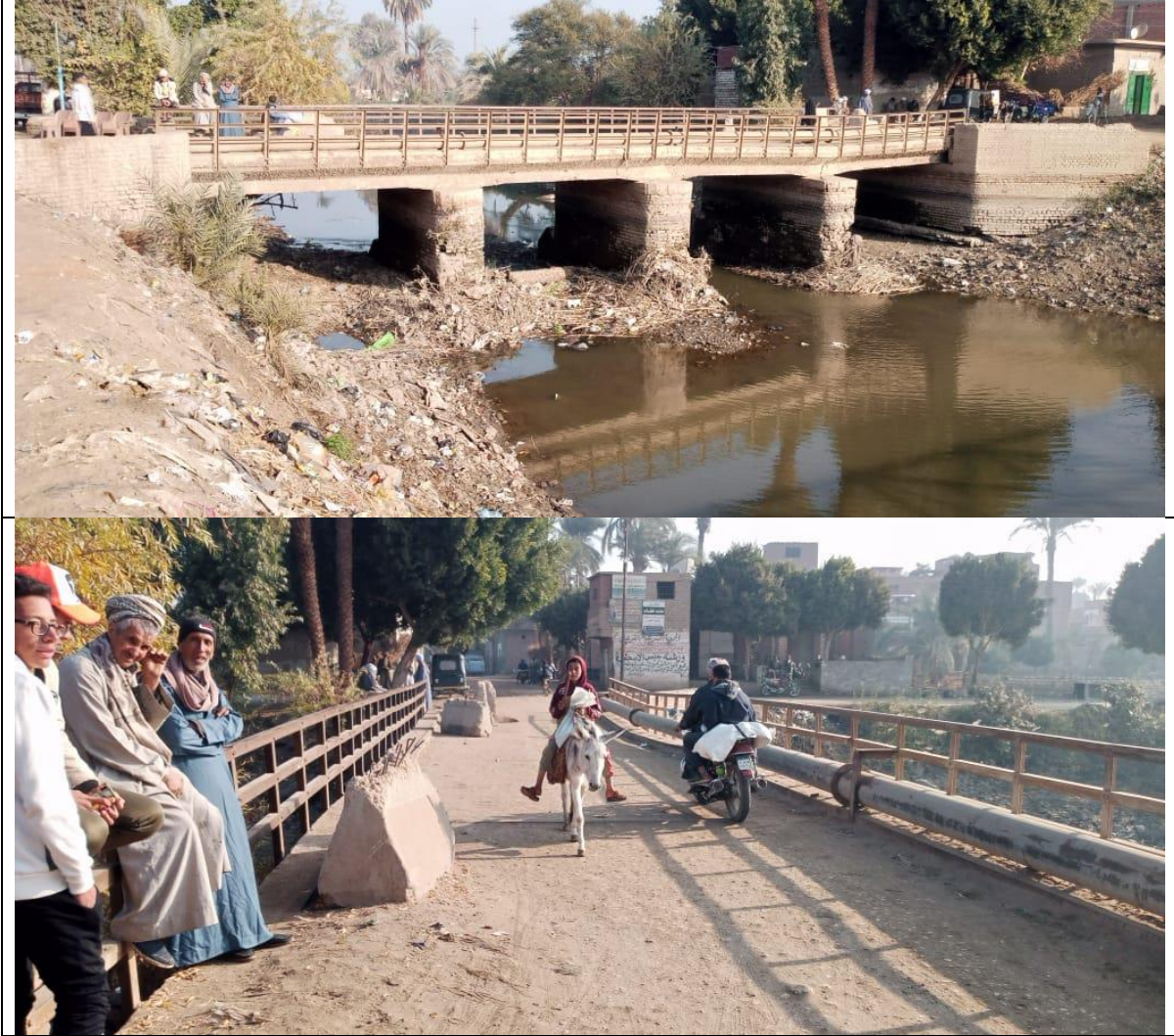
شكل (3-2): صور توضح تهالك القديم وسقوط الجانب الشرقي منه

ويعتبر الموقع الحالي هو الموقع الذي تستخدمه الأهالي للإنتقال من خلال الكوبري المتهاك والضيق والذي لا يكفي لمرور السيارات وخاصة في نقل منتجاتهم واحتياجاتهم من وإلى القرية.